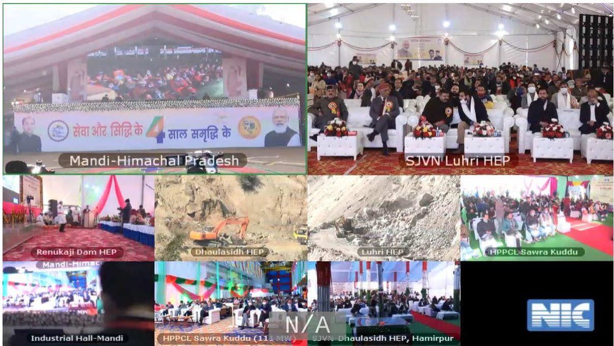
General View of the Launch Ceremony